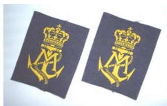
Skuldermærker kr. 50,00