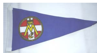
Vimpel kr. 110,00

Se i øvrigt hele varekataloget på Marineforeningens hjemmeside eller på Stuen.