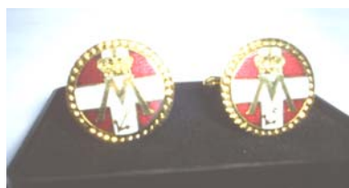
Manchetknapper kr. 95,00