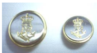
Blazerknapper 15 el. 20 mm kr. 6,50