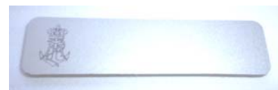
Navneskilt incl. gravering kr. 60,00