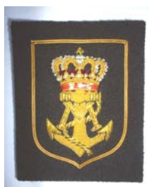
Blazeremblem kr. 125,00

Her er en oversigt over de varer, vi har på lager i øjeblikket.