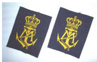
Skuldermærker kr. 50,00