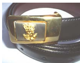
Læderbælte kr. 235,00