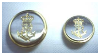
Blazerknapper 15 el. 20 mm kr. 6,50