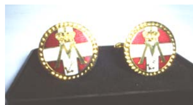
Manchetknapper kr. 95,00