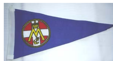
Vimpel kr. 110,00

Se i øvrigt hele varekataloget på Marineforeningens hjemmeside eller på Stuen.