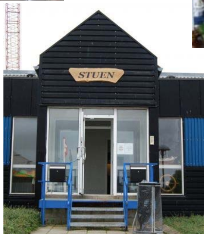
Indgangen til vores nye Marinestue.