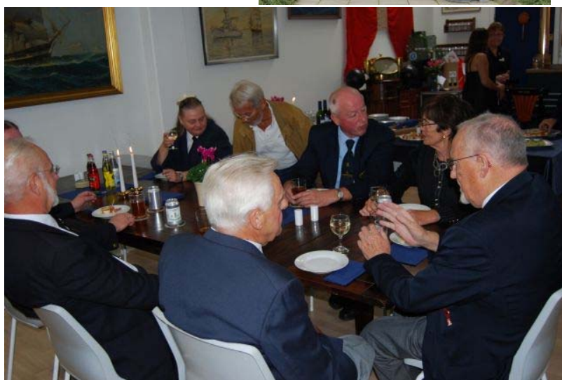
Der hygges ved bordene